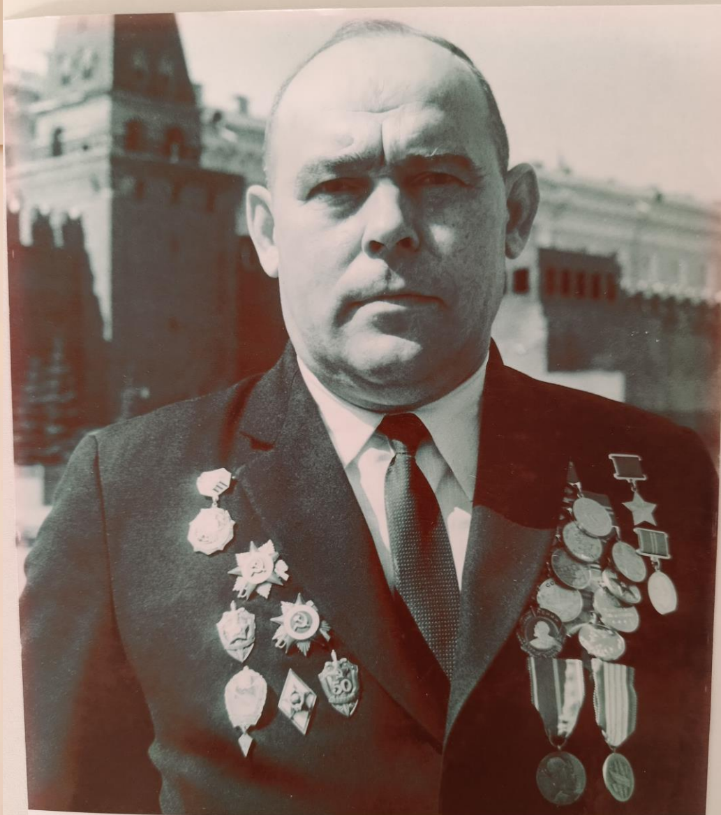
Дедотов Петр Иванович Герой Советского Союза