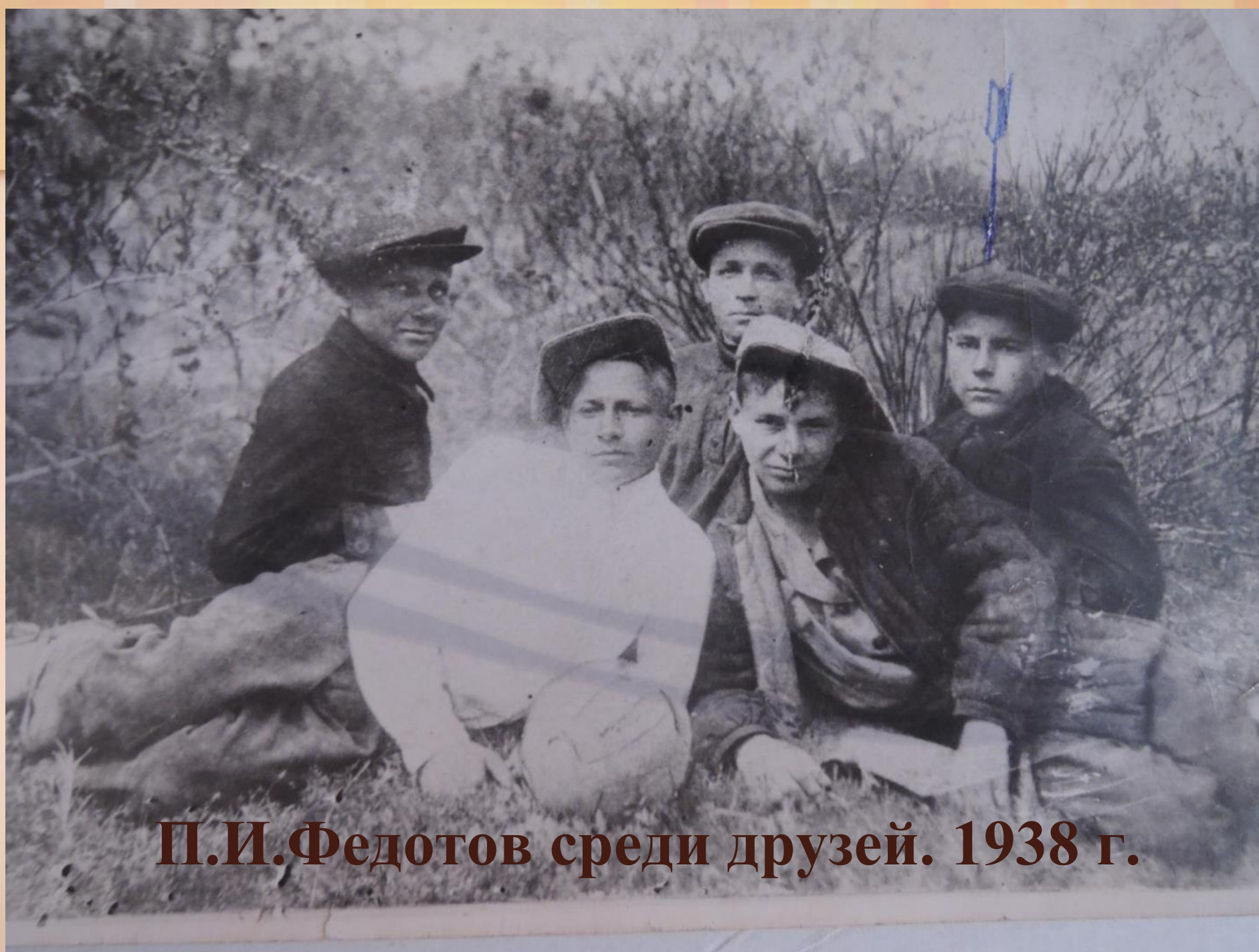
П.И.Федотов среди друзей. 1938 г.